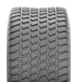
29 x 12,50-15