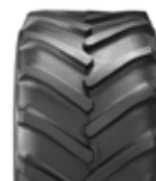
31 x 15,50-15