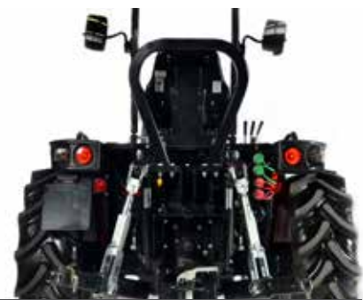
Anbau der 1. Kategorie