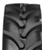
260/70 R16 280/70 R18