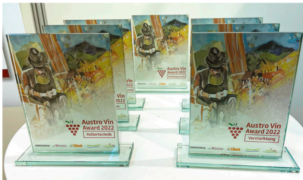
Foto: Austro Vin Award 2022

www.bauernzeitung.at/der-austro-vin-award-2024